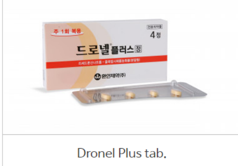
Dronel Plus tab.