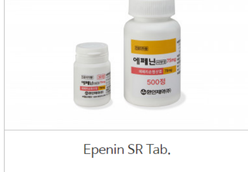
Epenin SR Tab.