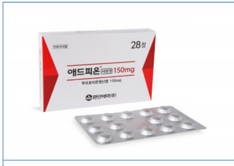
Addpion SR tab.