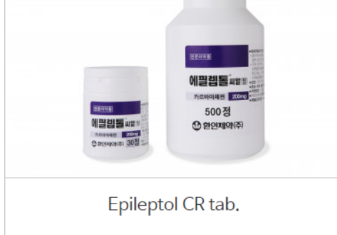
Epileptol CR tab.