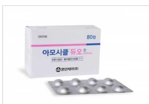
Amocicle Duo tab.