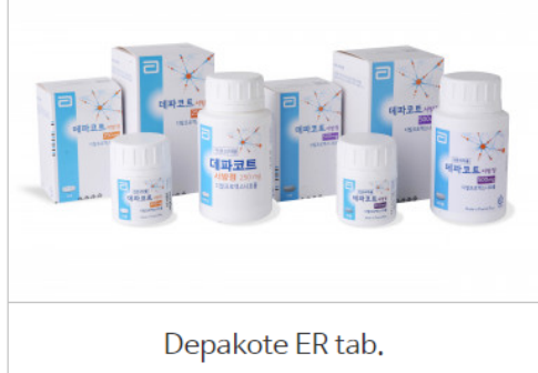
Depakote ER tab.