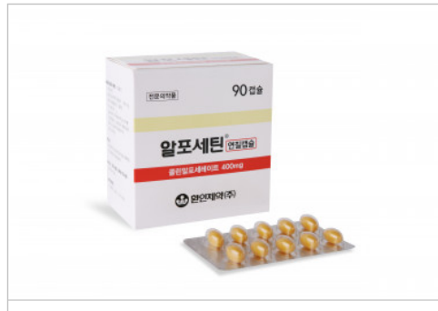
Alfocetine soft cap.