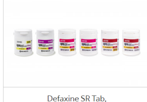
Defaxine SR Tab.