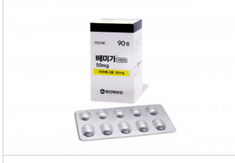
Bemiga SR Tab.